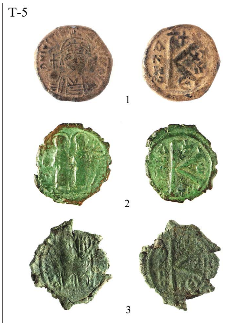
Табла 5: 1) Јустинијан I-Градиште, Љубинци; 2) Јустин II-Укоса, Град Сталаћ; 3) Јустин II-Бедем, Маскаре.

Panel 5: 1) Justinian I-Gradiste, Ljubinac, 2) Justin II-Italic, City Stalac, 3) Justin II-rampart, mascara.