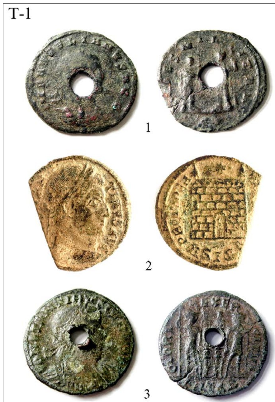
Табла 1: 1) Аурелијан-Градиште, Љубинци; 2) Константин I-Градиште, Љубинци; 3) Константина II-Градиште, Велика Грабовница

Panel 1: 1) Aurelian-Gradiste, Ljubinac, 2) Constantine I-Gradiste, Ljubinac, 3) Constantine II-Gradiste, United Grabovnica