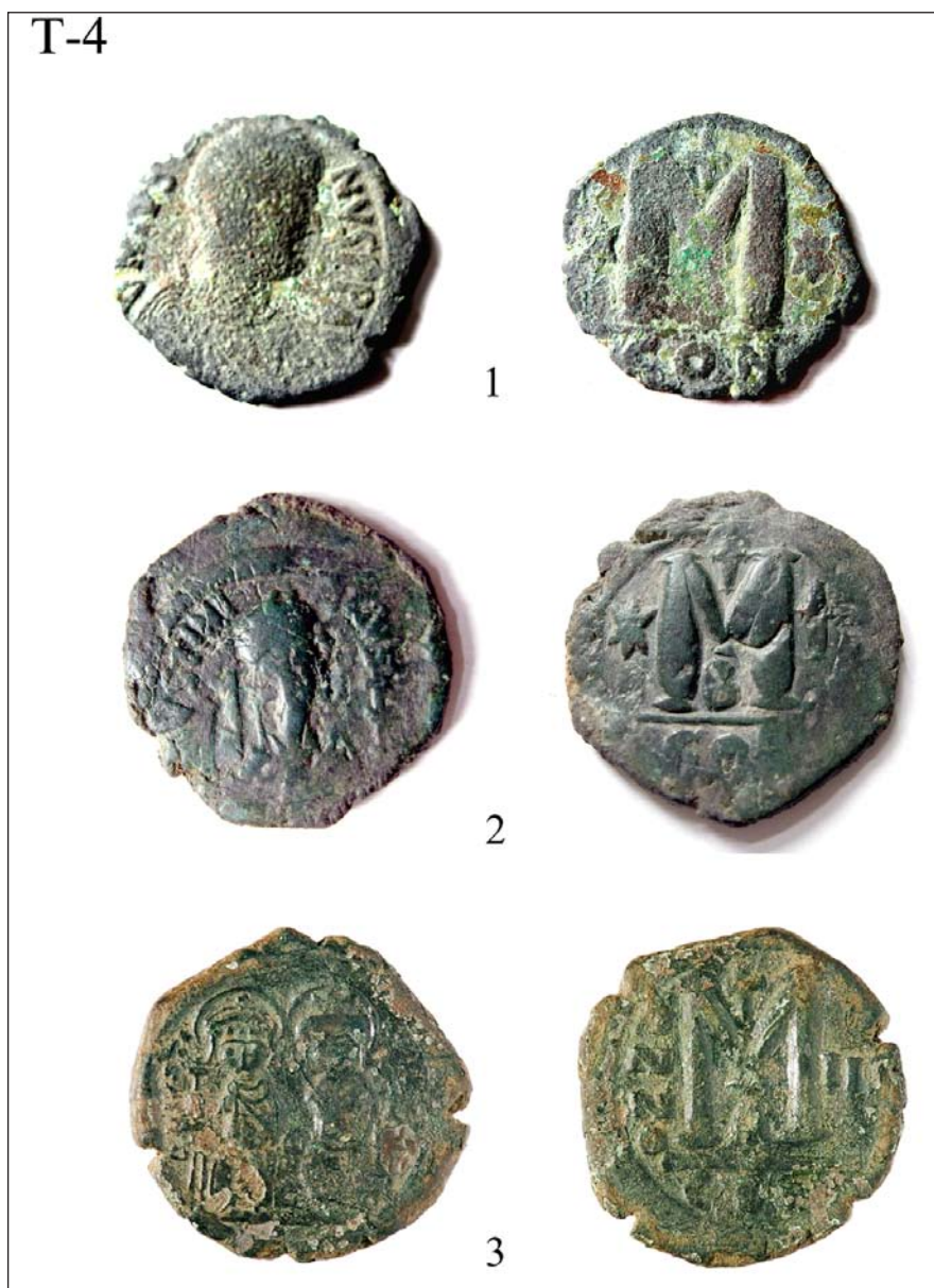
Табла 4: 1) Јустин I-Градац, Горњи Левићи; 2) Јустинијан I-Бедем, Маскаре; 3) Јустин II-Градац-Доњи Дубич.

Panel 4: 1) Justin I-Gradac, above the Left, 2) Justinian I-rampart, Mascara, 3) Justin II-Gradac-Donja Mahala.