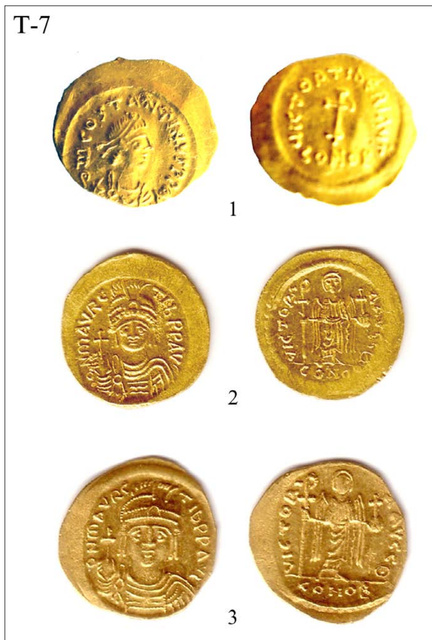
Табла 7: 1) Тиберије-Град више Жупањевца; 2) Маврикије-пут од Соко Бање према Липовцу; 3) Маврикије-Градиште, Озрен.