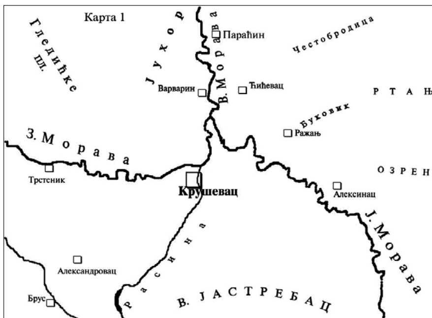
Карта 1: Подручје југа Централне Србије