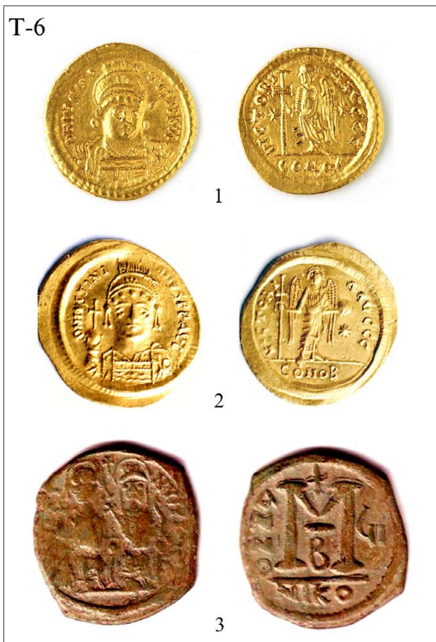
Табла 6: 1) Јустинијан I-Градац, Петина; 2) Јустинијан-Зарепак, Велика Грабовница; 3) Јустин II-Градиште, Читлук код Соко Бање.

Panel 6: 1) Justinian I-Gradac, fifth, 2) Justinian-Zarepak, United Grabovnica, 3) Justin II-Gradiste, Citluk near Soko Banja.