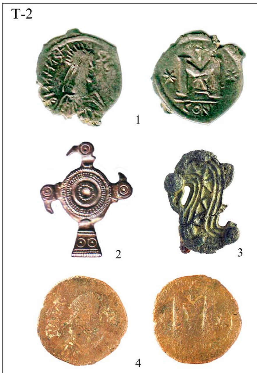
Табла 2: 1) Анастасије I (Варваризовано ковање)-Градиште, Рујевица; 2) Фибула-Градиште, Рујевица; 3) Фибула-Укоса, Град Сталаћ; 4) Анастасије I-Крушевац, Лазарев град.

Panel 2: 1) Anastasius I (Varvarizovano forging)-Gradište Rujevica, 2) Fibula-Gradište Rujevica, 3)-fibula obliquely, City Stalac, 4) Anastasius I-Krusevac, Lazarev grad.