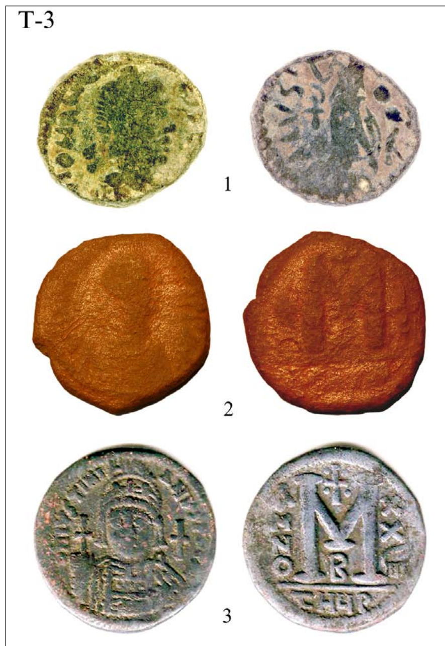
Табла 3: 1) Јован (Јоханес)-Небеске столице, Копаоник; 2) Анастасије I-Небеске столице, Копаоник; 3) Јустинијан I-Градиште, Озрен.